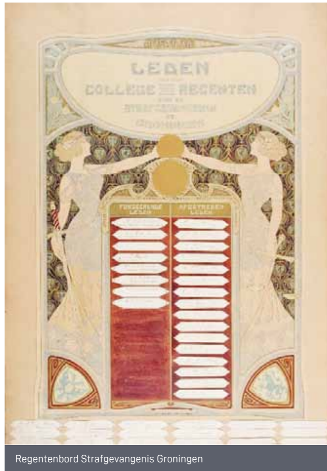
Regentenbord Strafgevangenis Groningen