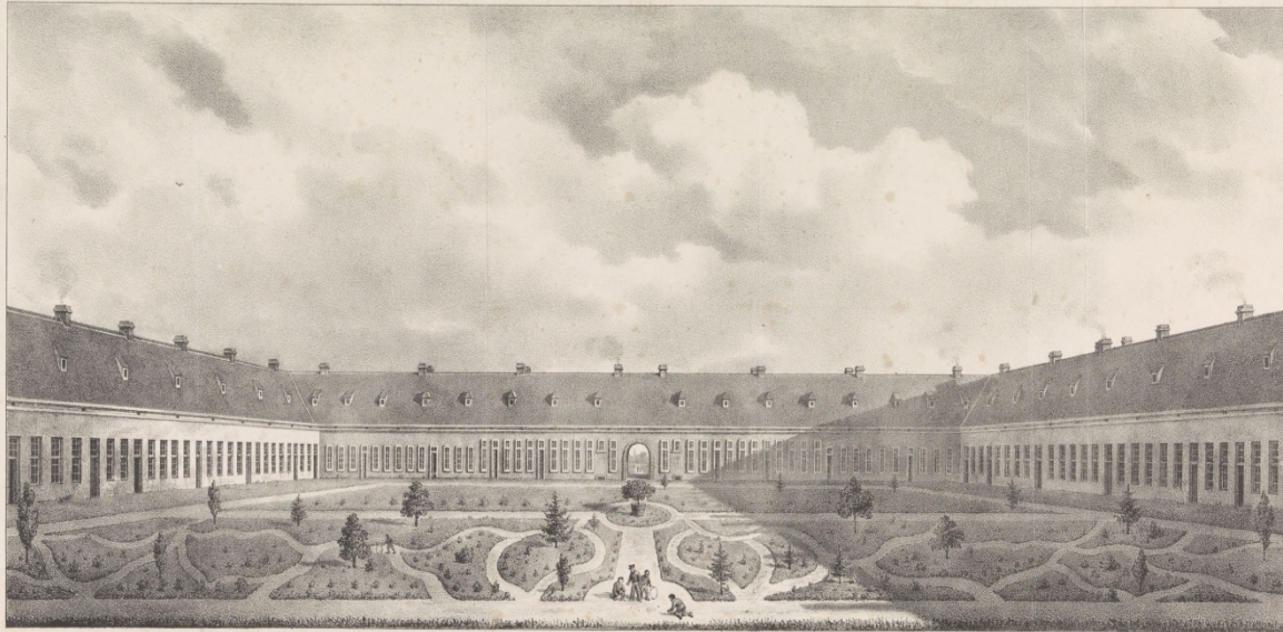
AFBEELDING VAN EEN GESTICHT VOOR KINDEREN TE VEENHUIZEN (Provincie Drenthe) van binnente zien.

Een actief, educatief programma van het Gevangenismuseum